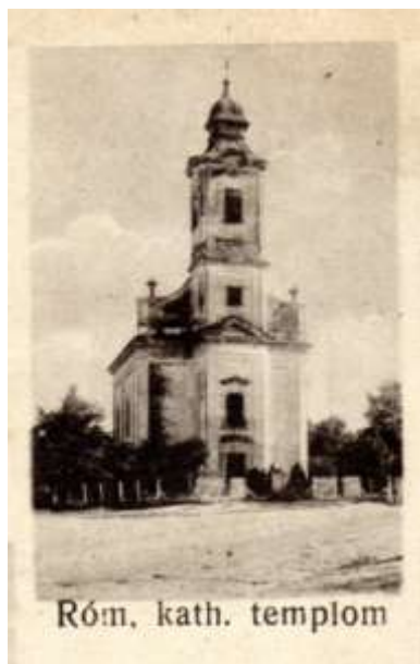
Róm. kath. templom